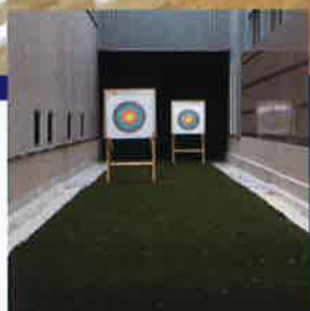
遠的場(アーチェリー)